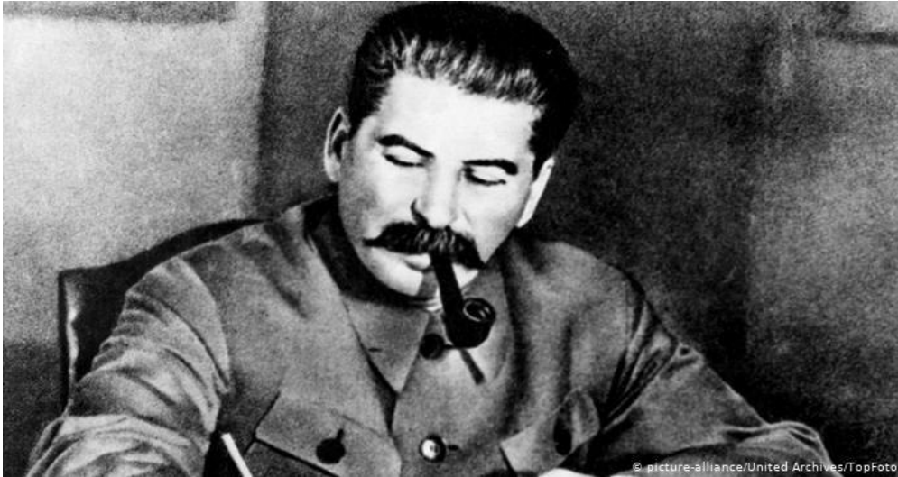
Josef Dzugasjvili (Stalin)